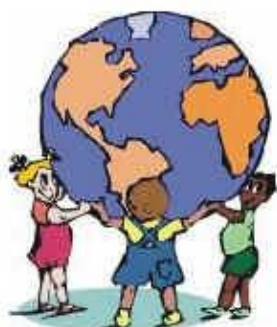
De vreedzame school

Basisschool Dommelrode werkt volgens het concept van De Vreedzame School